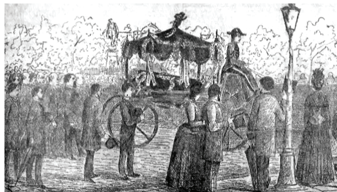
Cortegiul funerar al poetului, grafică de Constantin Jiquidi

La slujba prohodului, oficiată de un singur preot, răspunsurile la strană au fost date de corul Mitropoliei dirijat de C. Bărcănescu, unul dintre apropiații poetului. La finalul slujbei, tinerii coriști au interpretat corul pe versurile Mai am un singur dor . Melodia și versurile au emoționat profund asistența. Grigore Ventura, gazetar la „Adevărul”, a evocat personalitatea lui Eminescu, spunând între altele, patetic: „Acela ce zace aici înaintea noastră n-a fost al nimănui, ci al tuturor românilor. Nu e dar de mirare că toți îl plângem; dar lacrimile noastre, ale tuturor, se vor schimba în rouă roditoare și binefăcătoare sub razele luminoase ce va răs-pândi soarele amintirii poetului iubit”. După acest discurs, sicriul a fost așezat pe un dric simplu, cel de serviciu al pompelor funebre,