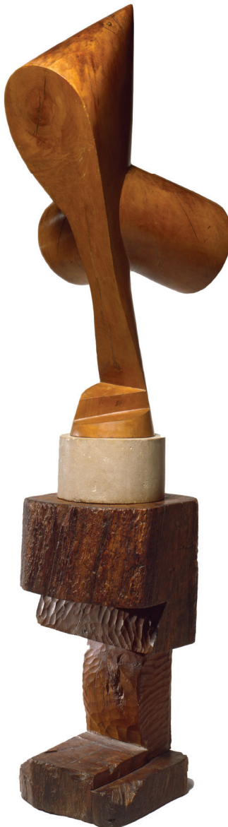
Constantin Brâncuși – Vrăjitoarea, 1916

Așa că ai plimbat în neștire pe o sută de metri câinele pe care nu îl aveai și nu îl ceruseși. El amușina mințile unui grup de studenți din amfiteatrul de peste drum și cum studenții erau prezenți doar în poze